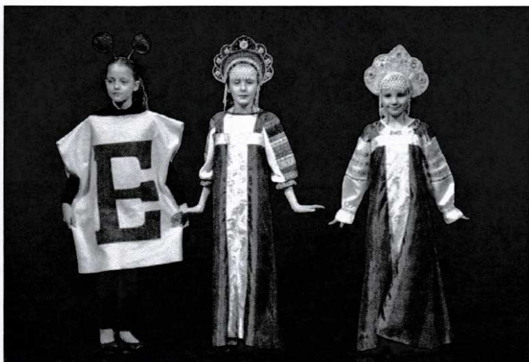
« Solnyshko », Nice