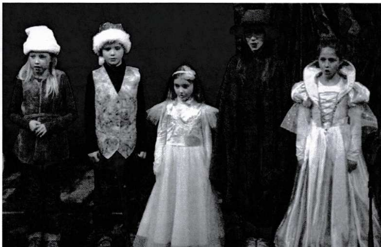
« Maison russe », Marseille