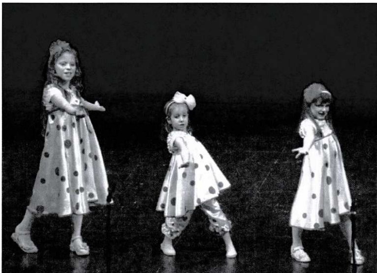
« Kalinka », Nîmes