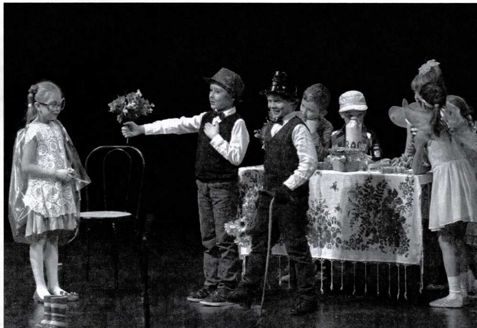
« Teremok », Marseille

Le 23 février, la 2e édition du Festival régional des centres russes d'enseignement extrascolaire en France s'est tenue à Marseille.