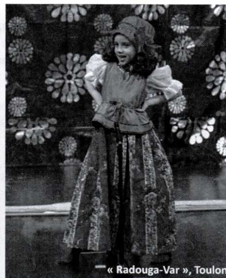
« Radouga-Var », Toulon