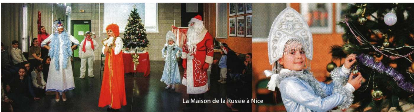
La Maison de la Russie à Nice

В новом праздничном и нарядном Центре двуязычного развития «Солнышко» ассоциации «Русский Альянс» в Ницце в этом году для 200 учеников школы прошло целых пять новогодних ёлок – по разным сценариям для разных возрастных