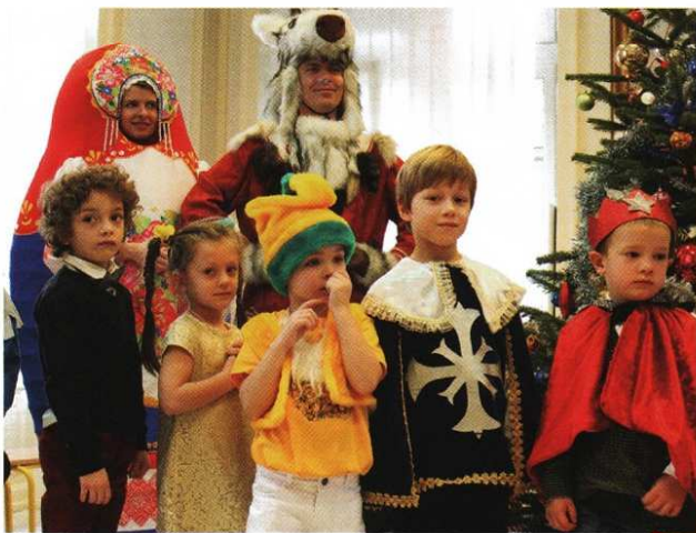
La Maison russe à Strasbourg

Le 19 décembre, à Strasbourg le spectacle du Nouvel An a réuni les élèves de l'école russe « Malenkaïa strana » ( petit pays ), et les artistes de l'ensemble chorégraphique « Rous », d'Omsk. L'association « La Maison russe à Strasbourg » en a été organi-