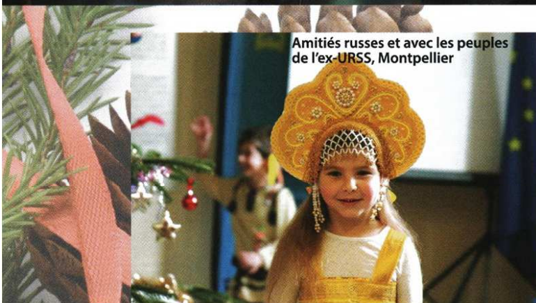
Amitiés russes et avec les peuples de l'ex-URSS, Montpellier