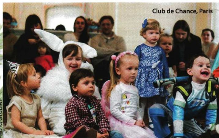
Club de Chance, Paris