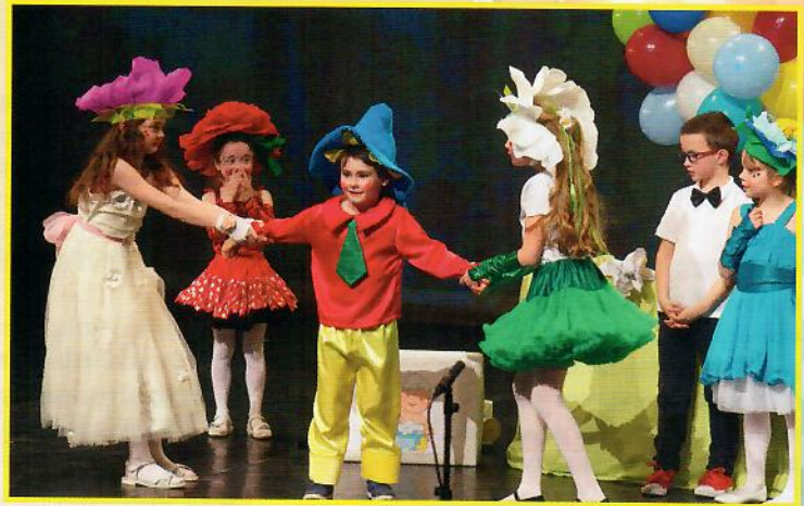
« Les enfants russes de Montpellier »