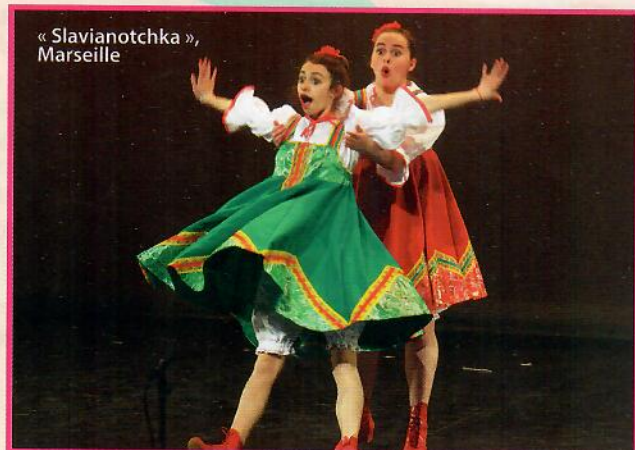
« Slavianotchka », Marseille