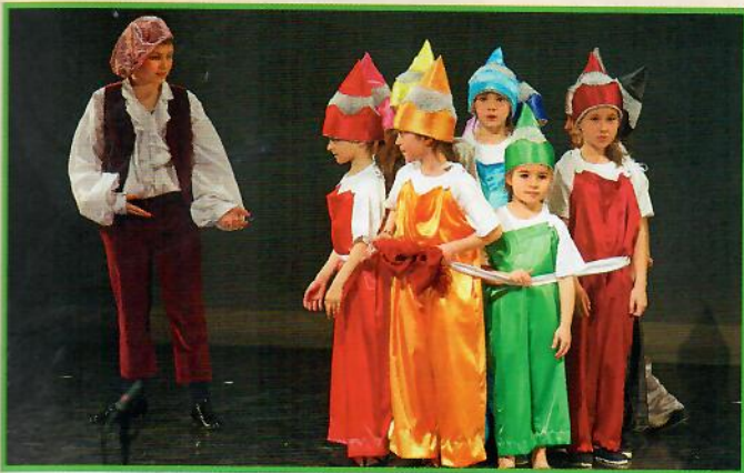
« Solnyshko », Nice