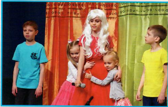
« Semitsvetik », Marseille