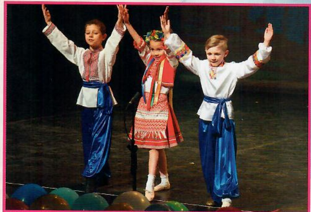
« Teremok », Marseille