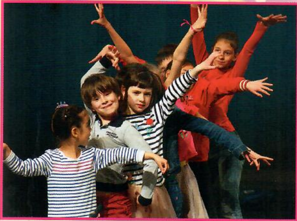
« Hironnelle », Montpellier